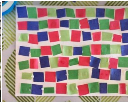
MOSAIC PATTERN ART fine motor art activity